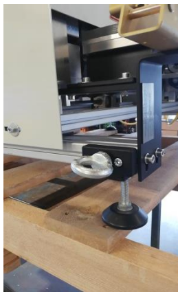
Kranöse und verstellbarer Fuss