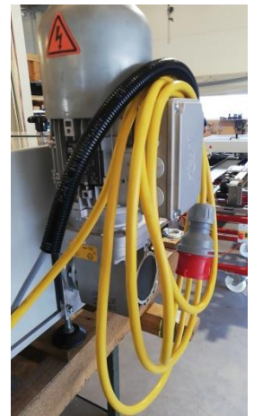
Motor mit 2m Kabel