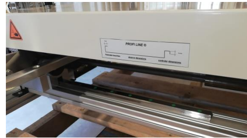
Rückseite mit Profilgrößen