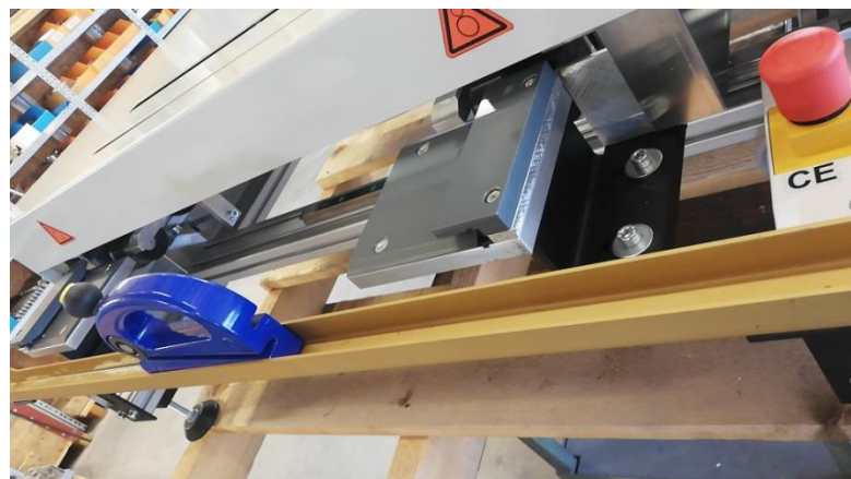
Schneideinrichtung (HS – Handschere)

Sie wollen weitere Infos? Dann kontaktieren Sie uns einfach: Herburger Maschinenbau GmbH, T +43 5574 73616 | office@herburger-maschinenbau.at