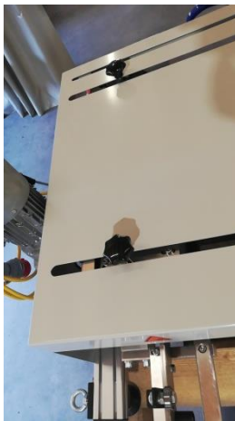
Breitenverstellung per Quick Step