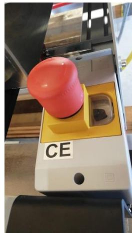
Ein/Aus-Schalter und Not-Aus (abnehmbar)